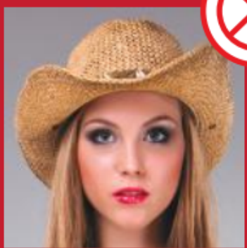
Uso de chapéus