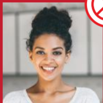
Paisagem ao fundo